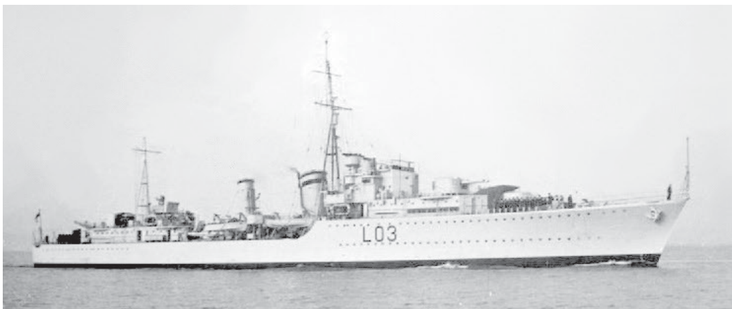
O estudado HMS Cossack L 03, é o quinto navio da marinha inglesa com esta designação

No caminho seriam implacavelmente atacados por bombardeiros alemães, sem que se registassem danos de maior, graças ao reforço da sua artilharia antiaérea. Durante grande parte desse ano de 1940, a 4.ª Flotilha seria envolvida na procura de comboios alemães ao largo da Noruega; de submarinos ao largo da Irlanda e de navios de grande importância ao largo da Islândia. Seria com este propósito que em 26 de maio de 1941, o HMS Cossack a comandar a 4.ª Flotilha juntar-se-ia à Home Fleet inglesa em busca do poderoso Bismarck , rendendo os destroyers próprios da