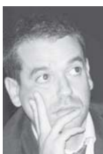
Por: Sérgio Rezendes *

O HMS Cossack é um destroyer inglês, classe Tribal, construído pelo construtor Vickers-Armstrong, High Walker Yard, The Tyne. Encomendado em 1936, seria lançado ao mar a oito de junho de 1937 e considerado pronto para todo o serviço a catorze de junho do ano seguinte. Perdido